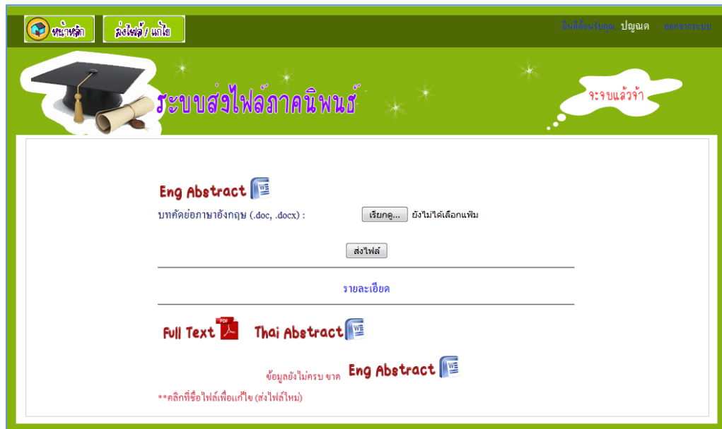
ภาพที่ 5 แสดงการส่งไฟล์บทความภาษาอังกฤษรูปแบบไฟล์ doc, docx