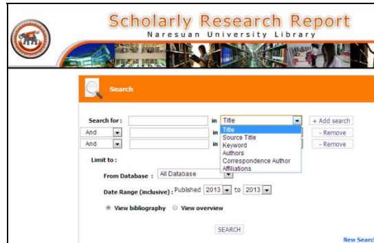
แผนผังการทำงานของระบบฐานข้อมูล NU Scholarly Research Report ส่วนสืบค้นงานวิจัย

3) ส่วนผู้ดูแลระบบ ในการนำข้อมูลเข้าระบบ จากฐานข้อมูล Scopus และ ISI Web of Knowledge นั้น สามารถ Export File ออกมาในรูปแบบ File text ซึ่งสามารถนำมาแปลงเป็น File Excel เพื่อทำการ Import ลงใน ฐานข้อมูลได้ ทำให้สะดวกแก่การนำข้อมูลเข้าระบบ และมีการจัดการ ตรวจสอบ แก้ไขข้อมูลในแต่ละชื่อเรื่องได้