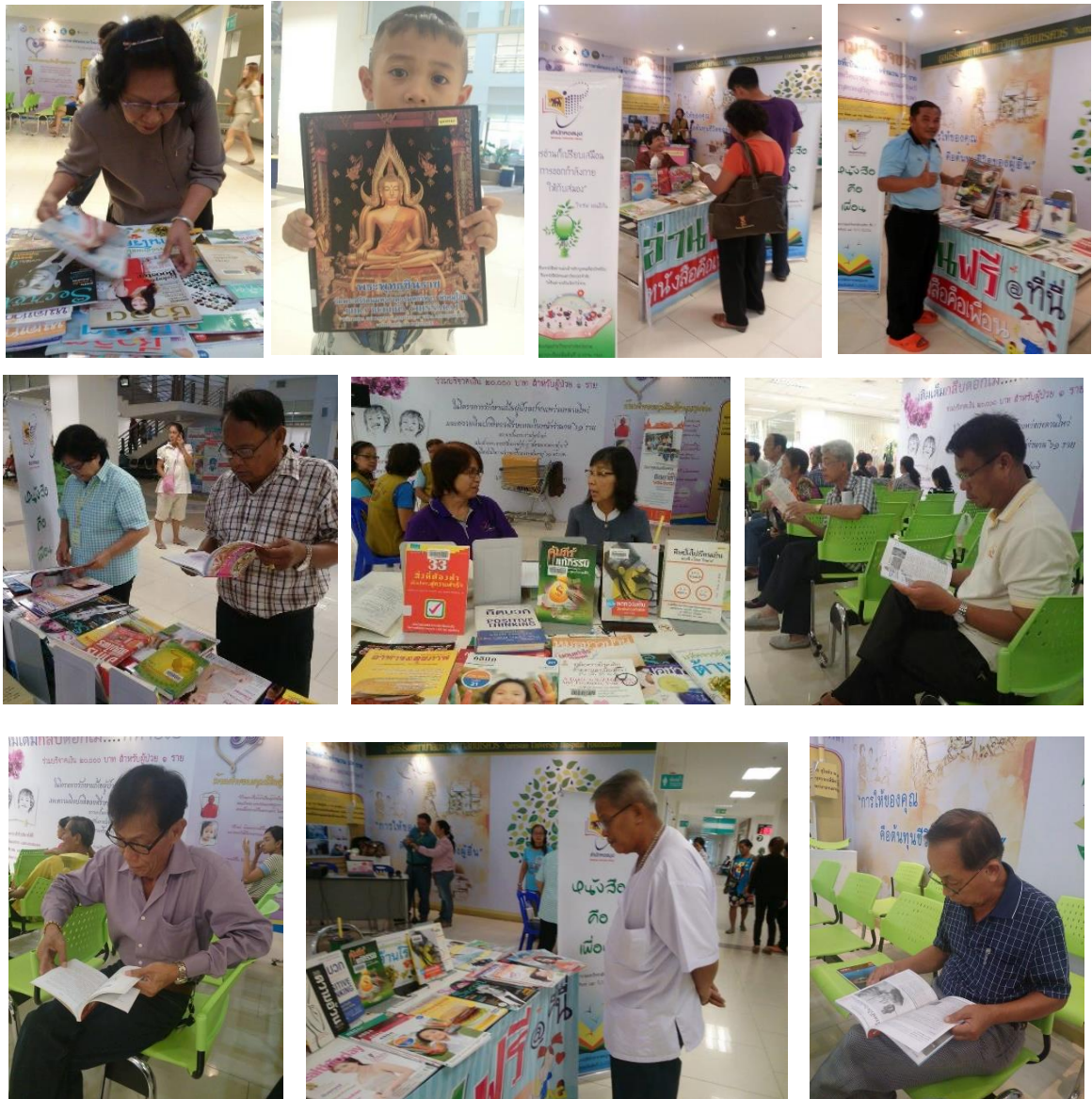
ภาพที่ 1 การจัดโครงการหนังสือคือเพื่อน ปี 2556-2558

การประเมินผลโครงการ ผู้จัดกิจกรรมได้ดำเนินการสำรวจความพึงพอใจและความคิดเห็นของผู้เข้าร่วมโครงการ เพื่อนำผลการประเมินมาวิเคราะห์จุดอ่อนจุดแข็ง ปรับปรุงและพัฒนาแนวทาง รูปแบบ การจัดกิจกรรมให้สอดคล้องกับความต้องการของผู้เข้าร่วมโครงการ โดยมีผลการประเมินดังแสดงในตารางที่ 3