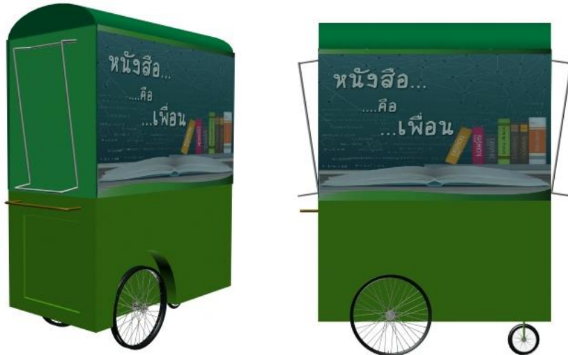
ภาพที่ 2 แบบร่างรถ Book Cafe Mobile

สารสนเทศได้อย่างเต็มที่ ทางห้องสมุดจึงได้ขออนุมัติจัดทำรถ Book Café เคลื่อนที่ เพื่อเพิ่มความสะดวกในการจัดกิจกรรม และประสานงานกับชมรมจิตอาสาโรงพยาบาล มหาวิทยาลัยนเรศวร นิสิตจิตอาสา เพื่อมาร่วมดำเนินกิจกรรม