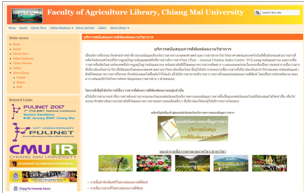
ภาพที่ 2 เว็บไซต์บริการสนับสนุนการตีพิมพ์ผลงานวิชาการ คณะเกษตรศาสตร์ มหาวิทยาลัยเชียงใหม่ ( http://library.cmu.ac.th/faculty/agric/en )

รายชื่อวารสาร (สกุล .xls) แยกตามภาควิชาและสาขาวิชาของคณะเกษตรศาสตร์ ผู้ใช้บริการสามารถเลือกภาควิชา/สาขาวิชา เพื่อเข้าดูรายชื่อวารสารที่มีความเกี่ยวข้องกับภาควิชา นั้น ๆ และเป็นวารสารที่ปรากฏในฐานข้อมูลสากล สำหรับเป็นทางเลือกกว่ามีวารสารใดที่สามารถส่งผลงานวิชาการไปตีพิมพ์ได้ นอกจากนี้ ยังเชื่อมโยงไปยังเว็บไซต์ https://scholarlyoa.com ซึ่งเป็นเว็บไซต์รวบรวมรายชื่อวารสารและสำนักพิมพ์ที่อยู่ใน Beall's list ที่ถูกจัดว่าเป็นแหล่งที่ไม่ควรส่งผลงานวิชาการไปร่วมตีพิมพ์หรือร่วมประชุมวิชาการ