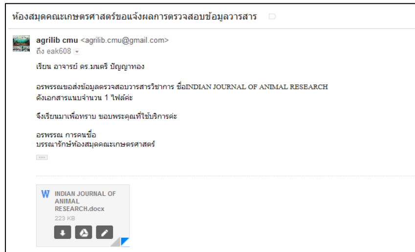
ภาพที่ 5 ตัวอย่างอีเมลการส่งข้อมูลวารสารแก่ผู้ใช้บริการ