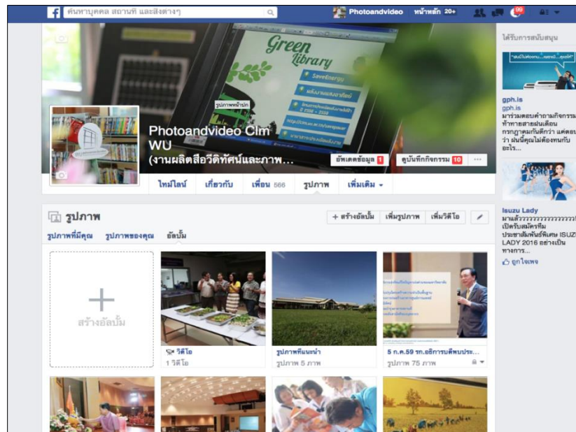
ภาพที่ 2 แสดงการเผยแพร่ภาพนิ่งผ่าน facebook ด้วย user “photoandvideo Clm WU” https://www.facebook.com/PhotoandVDO.WU

2. ภาพนิ่ง เผยแพร่ภาพถ่ายกิจกรรมเหตุการณ์ ภาพบุคคล ที่งานผลิตสื่อวีดิทัศน์และภาพนิ่งได้บันทึกไว้ และภาพบรรยากาศของมหาวิทยาลัยวลัยลักษณ์ เพื่ออำนวยความสะดวกสำหรับผู้ที่ต้องการภาพไปใช้ประโยชน์ ซึ่งจะนำเสนอผ่านช่องทางต่าง ๆ ดังภาพที่ 2