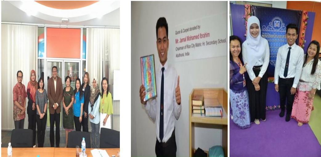
6. สรุปและประเมินผลการดำเนินงาน