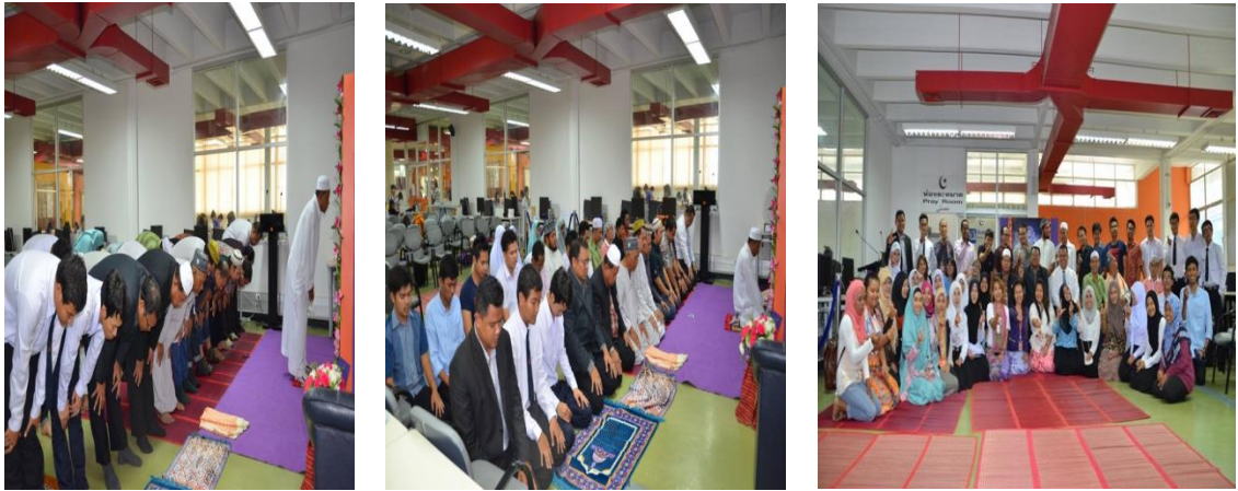
5. กำหนดแนวทางในการดูแล บริหารจัดการห้องละหมาด โดยมีบุคลากรห้องสมุดและนักศึกษาชมรมมุสลิม ดำเนินงานร่วมกัน