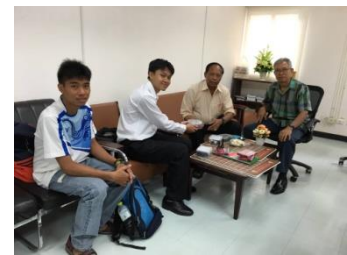
มอบอุปกรณ์กีฬาจากชมรมหมากระดาน มช.