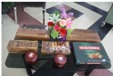
มอบอุปกรณ์กีฬา งบประมาณ (1)