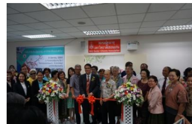
พิธีเปิดชมรม (3)