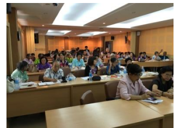
อบรมเรื่องการถ่ายภาพให้สวยงามภายใน 3 ชั่วโมง (3)