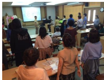
อบรมเรื่องการถ่ายภาพให้สวยงามภายใน 3 ชั่วโมง (2)