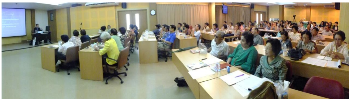
บรรยายพิเศษเรื่อง กฎหมายและสิทธิประโยชน์ของผู้สูงอายุและการเขียนพินัยกรรม (2)