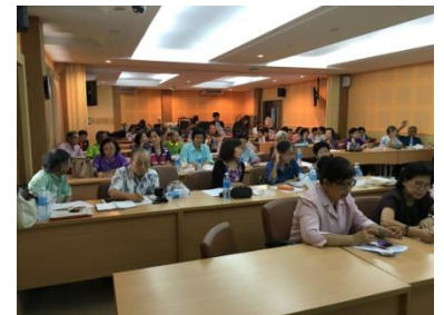
อบรมการใช้ Social Media เพื่อการสื่อสารเบื้องต้น (3)