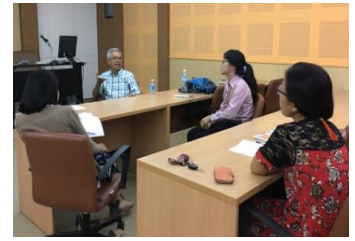
การสอนสนทนาภาษาอังกฤษ (3)