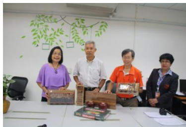
มอบอุปกรณ์กีฬา งบประมาณ (2)