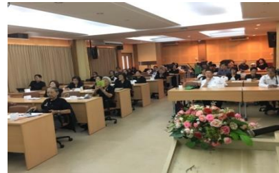
การอบรมเรื่องการดูแลข้อและกระดูกในผู้สูงอายุ (3)