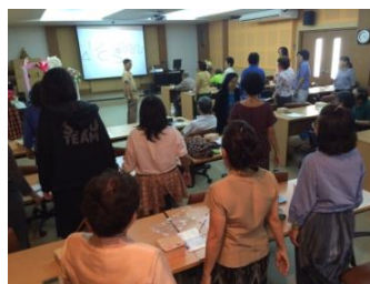
อบรมเรื่องการถ่ายภาพให้สวยภายใน 3 ชั่วโมง (2)