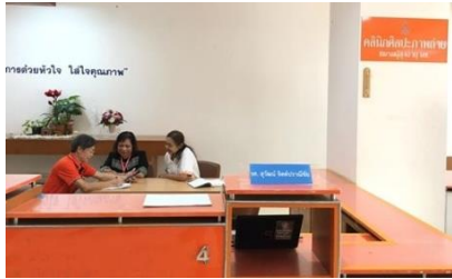
คลินิกแนะนำศิลปะการถ่ายภาพ (1)