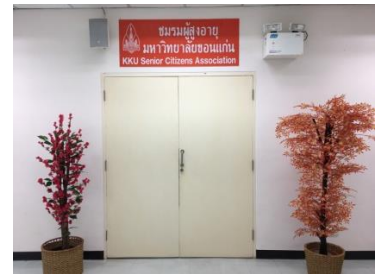
เตรียมห้องชมรม (3)