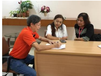
คลินิกแนะนำศิลปะการถ่ายภาพ (2)