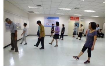
การออกกำลังกาย เดินบาสโลบ