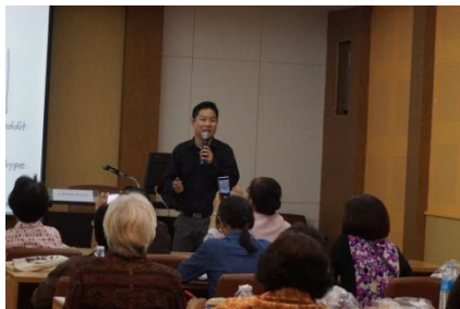
อบรมการใช้ Social Media เพื่อการสื่อสารเบื้องต้น (1)