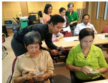
อบรมการใช้ Social Media เพื่อการสื่อสารเบื้องต้น (2)