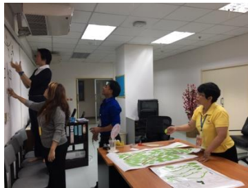
เตรียมห้องชมรม (2)