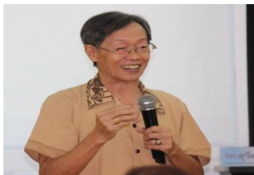
อบรมเรื่องการถ่ายภาพให้สวยงามภายใน 3 ชั่วโมง (1)