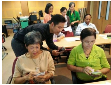
อบรมการใช้ Social Media เพื่อการสื่อสารเบื้องต้น (2)