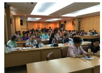
อบรมเรื่องการถ่ายภาพให้สวยภายใน 3 ชั่วโมง (3)