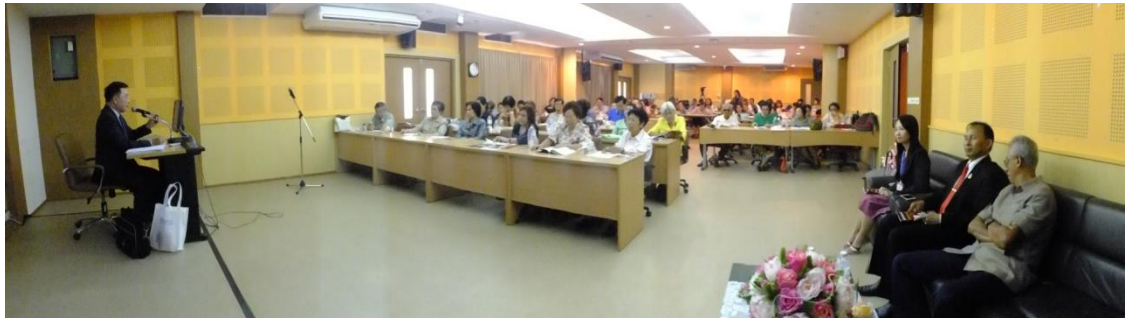
บรรยายพิเศษเรื่อง กฎหมายและสิทธิประโยชน์ของผู้สูงอายุและการเขียนพินัยกรรม (1)