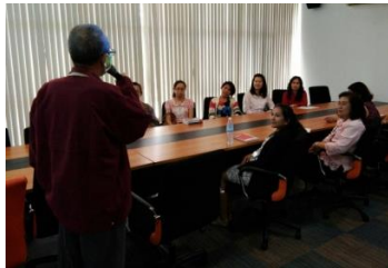
การสอนสนทนาภาษาอังกฤษ (1)