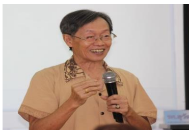
อบรมเรื่องการถ่ายภาพให้สวย ภายใน 3 ชั่วโมง (1)