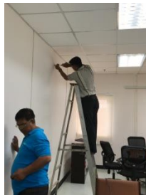
เตรียมห้องชมรม (1)