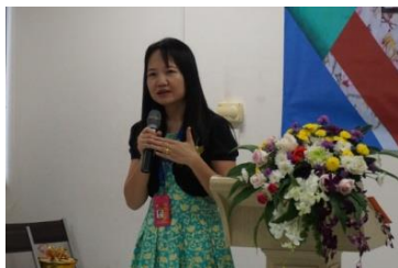
พิธีเปิดชมรม (1)