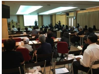
การอบรมเรื่องการดูแลข้อและกระดูกในผู้สูงอายุ (2)