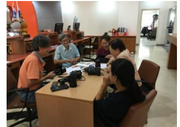
คลินิกแนะนำศิลปะการถ่ายภาพ(3)