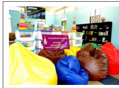
ภาพที่ 1 การปรับปรุงสภาพแวดล้อมห้องสมุด

4. การอบรมความรู้พื้นฐานด้านการจัดการห้องสมุดสำหรับครู-นักเรียนที่ปฏิบัติงานในห้องสมุด เพื่อให้บรรณารักษ์มีความรู้และความเป็นมืออาชีพในการปฏิบัติงาน