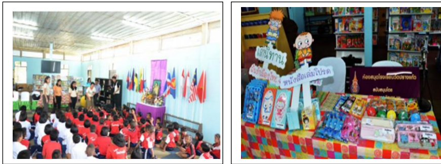
ภาพที่ 3 กิจกรรมส่งเสริมการอ่าน

จากการดำเนินการโครงการห้องสมุดโรงเรียนต้นแบบ ตั้งแต่เดือนตุลาคม 2556 - เดือนกันยายน 2559 มีการสำรวจความพึงพอใจของนักเรียนที่เข้าร่วมโครงการจำนวน 6 โรงเรียน จำนวน 410 คน ผลการจัดกิจกรรมพบว่า นักเรียนที่เข้าร่วมกิจกรรมมีความพึงพอใจอยู่ในระดับดีมาก (ค่าเฉลี่ย 4.70) และมีการสัมภาษณ์ผู้บริหาร บรรณารักษ์ และครูที่ดูแลงานห้องสมุด ให้ข้อเสนอแนะ ดังนี้