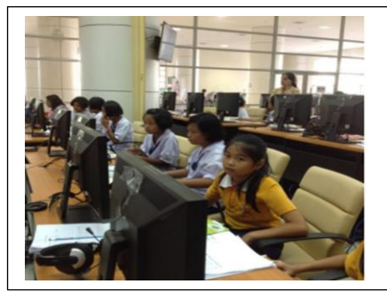
ภาพที่ 2 การอบรมความรู้พื้นฐานการจัดการห้องสมุด

ผลจากการจัดอบรมเชิงปฏิบัติการเรื่องความรู้พื้นฐานการจัดการห้องสมุดและระบบห้องสมุดอัตโนมัติ ULibM ทำให้โรงเรียนที่เข้าร่วมโครงการสามารถติดตั้งระบบ ULibM สร้างฐานข้อมูลการสืบค้นได้เอง และมีนักเรียนระดับชั้นประถมศึกษาปีที่ 4-6 ทำหน้าที่ยุวบรรณารักษ์ช่วยงานห้องสมุดได้อย่างดี