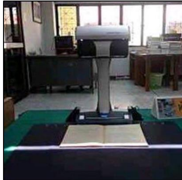
ภาพที่ 1 เครื่อง ScanSnap

(2) ขั้นตอนการจัดเตรียมข้อมูลภาพ เป็นกระบวนการในการสแกนหนังสือสมุดไทยโดยจะใช้เครื่อง ScanSnapในการจัดการภาพโดยเครื่องมือตัวนี้จะประกอบไปด้วยแสงเลเซอร์ที่สามารถรับความละเอียดของภาพได้ถึง 285 dpi to 218 dpi