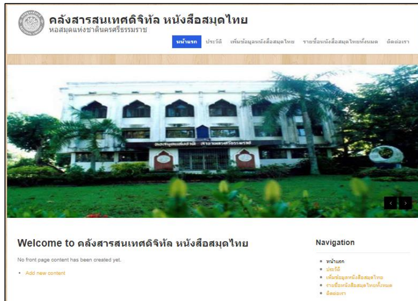
ภาพที่ 2 แสดงเมนูหน้าแรก