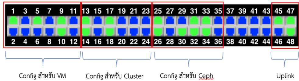
ภาพที่ 2 การออกแบบโครงสร้างพื้นฐานของระบบเครือข่ายส่วนกลาง

ขั้นตอนที่ 3 การติดตั้งค่าอุปกรณ์เครือข่ายให้ทำงานแบบรวมลิงค์