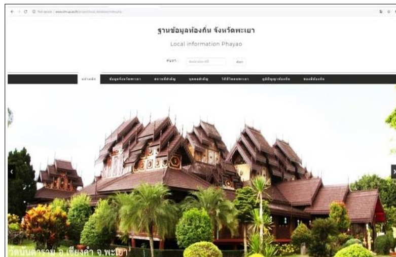
ภาพที่ 1 หน้าเว็บไซต์ข้อมูลท้องถิ่นจังหวัดพะเยา