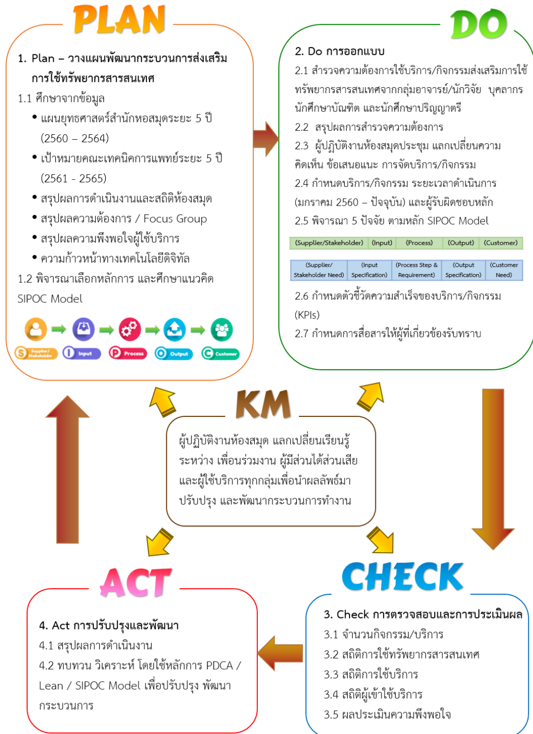
ภาพที่ 1 กระบวนการส่งเสริมการใช้ทรัพยากรสารสนเทศ ห้องสมุดคณะเทคนิคการแพทย์ มหาวิทยาลัยเชียงใหม่