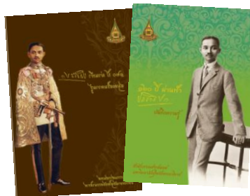
ภาพที่ 7 สมุดเสริมความรู้ และบันทึกความรู้

3.3 สมุดเสริมความรู้ และบันทึกความรู้ 120 ปี ผ่านฟ้า ประชาธิปไตย เป็นสมุดบันทึกที่จัดทำขึ้นเพื่อเสริมความรู้เกี่ยวกับ พระบาทสมเด็จพระปกเกล้าเจ้าอยู่หัว และเรื่องราวต่างๆ ที่เกิดขึ้นใน รัชสมัย เกล็ดเล็กเกร็ดน้อยที่เกี่ยวข้องกับพระองค์ท่านที่น่าสนใจ ดวง ตราสำคัญๆ เช่น ตราพระราชลัญจกรประจำพระองค์ พระปรมาภิไธย เข็มสหชาติและเข็มอุปชาติ เป็นต้น