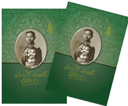
ภาพที่ 5 หนังสือ 120 ปี ผ่านฟ้า ประชาธิปก

3.1 หนังสือ 120 ปี ผ่านฟ้า ประชาธิปก เป็นหนังสือเฉลิมพระเกียรติพระบาทสมเด็จพระปกเกล้าเจ้าอยู่หัวในวาระโอกาสครบ 120 ปี วันคล้ายวันพระราชสมภพ 8 พฤศจิกายน 2556 เนื้อหาของหนังสือแบ่งออกเป็น 3 ตอน ตอนที่ 1 รวบรวมบทความวิชาการเขียนโดยผู้ทรงคุณวุฒิ จำนวน 13 บทความที่เกี่ยวกับพระราชประวัติ พระราชกรณียกิจต่างๆ และความสนพระราชหฤทัยในพระบาทสมเด็จพระปกเกล้าเจ้าอยู่หัว ตอนที่ 2 เป็นบทความที่แสดงถึงเรื่องราวการจัดตั้งห้องพระบาทสมเด็จพระปกเกล้าเจ้าอยู่หัว และสมเด็จพระนางเจ้ารำไพพรรณี พระบรมราชินี เพื่อเป็นห้องเอกสารที่รวบรวมสารสนเทศเกี่ยวกับพระปกเกล้าศึกษา