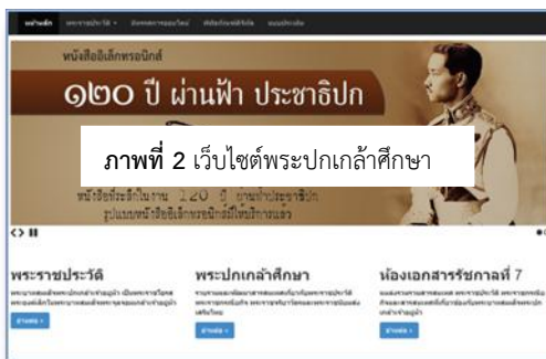
ภาพที่ 2 หน้าจอเว็บไซต์พระปกเกล้าศึกษา

1.3 การพัฒนาเว็บไซต์พระปกเกล้าศึกษาเพื่อเป็นช่องทางการเข้าถึงสารสนเทศพระปกเกล้าศึกษาได้ตลอด 24 ชั่วโมง เว็บไซต์พระปกเกล้าศึกษาให้ข้อมูลสำคัญๆ เกี่ยวกับพระราชประวัติ พระราชกรณียกิจ พระราชจริยาวัตร และรวบรวมพระราชวลี พระบรมราชาบาทที่นาสนใจของรัชกาลที่ 7 นอกจากนี้ยังให้สารสนเทศเกี่ยวกับพิพิธภัณฑ์ดิจิทัล ห้องเอกสารรัชกาลที่ 7 นิทรรศการออนไลน์และข่าวสาร กิจกรรมที่น่าสนใจเกี่ยวกับ