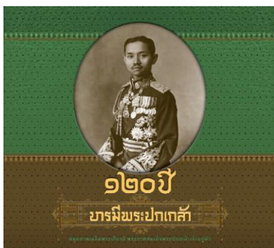
ภาพที่ 6 หนังสือ 120 ปี บารมีพระปกเกล้า

3.2 สมุดภาพเฉลิมพระเกียรติพระบาทสมเด็จพระปกเกล้าเจ้าอยู่หัว ๑๒๐ ปี บารมีพระปกเกล้า สมุดภาพเฉลิมพระเกียรติ พระบาทสมเด็จพระปกเกล้าเจ้าอยู่หัว 120 ปี บารมีพระปกเกล้าเป็นสมุด