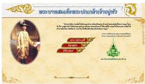
ภาพที่ 4 หน้าจอพิพิธภัณฑ์ดิจิทัลรัชกาลที่ 7

2.3 นิทรรศการถาวรในห้องพระบาทสมเด็จพระปกเกล้าเจ้าอยู่หัว และสมเด็จพระนางเจ้ารำไพพรรณี พระบรมราชินี (ห้องเอกสารรัชกาลที่ 7) เป็นการจัดนิทรรศการประเภทสิ่งของ เครื่องใช้ และสารสนเทศส่วนพระองค์ที่น่าสนใจในตู้นิทรรศการถาวรที่ติดตั้งแสดงในห้องเอกสารรัชกาลที่ 7 โดยมีวัตถุประสงค์เพื่อเผยแพร่ความรู้ และนำเสนอข้อมูลที่ที่น่าสนใจเกี่ยวกับสิ่งของ ของใช้ อาทิ แผ่นเสียงส่วนพระองค์ พระราชหัตถเลขาส่วนพระองค์ กล้องพระอิสถมวน ดวงตราและเหรียญตราสำคัญๆ ในรัชสมัยของล้นเกล้าฯ รัชกาลที่ 7 นิทรรศการถาวรนี้ อาจจะมีการเปลี่ยนแปลงเนื้อหาไปตามวาระโอกาสต่างๆ ที่เกี่ยวข้องกับพระบาทสมเด็จพระปกเกล้าเจ้าอยู่หัว