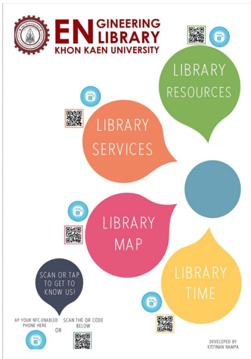
ภาพที่ 2 สมาร์ทโปสเตอร์ของห้องสมุดวิศวกรรมศาสตร์ มหาวิทยาลัยขอนแก่น

สามารถดาวน์โหลดโปรแกรมเพื่อใช้สแกน QR code ก็จะสามารถอ่านรายละเอียดได้เช่นเดียวกัน สำหรับการทดลองในครั้งนี้เป็นการทดลองที่ใช้ห้องสมุดคณะวิศวกรรมศาสตร์ มหาวิทยาลัยขอนแก่นเป็นต้นแบบ หากจะนำไปใช้กับหน่วยงานอื่น ๆ ก็จะมีรายละเอียดที่แตกต่างกันซึ่งทั้งนี้จะขึ้นอยู่กับความต้องการของแต่ละหน่วยงานว่าต้องการที่จะสื่อสารอะไรบ้างกับลูกค้าหรือผู้ใช้บริการ ทั้งนี้การออกแบบโปสเตอร์ก็ไม่ได้มีข้อจำกัดในกฎเกณฑ์ หรือรูปแบบทั้งในเรื่องขนาด วัสดุ ซึ่งสามารถเลือกใช้ได้ตามความเหมาะสม อุปกรณ์ที่สำคัญอื่น ๆ ก็คือ NFC tag ที่ภายในต้องบรรจุข้อมูล NDEF ภาพที่แสดงจุดสัมผัส (รายละเอียดปรากฏในภาพที่ 2) และโปรแกรมที่สามารถแปลงข้อมูลเพื่อให้อ่านได้จาก Smart Phone