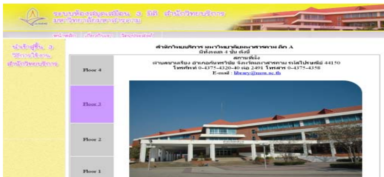
ภาพที่ 3 ภาพรวมระบบห้องสมุดเสมือน 3 มิติ

ขั้นตอนที่ 3 นำแบบจำลอง 3 มิติเข้าสู่เว็บเพจและกำหนดตำแหน่งสารสนเทศดั่งภาพที่ 3