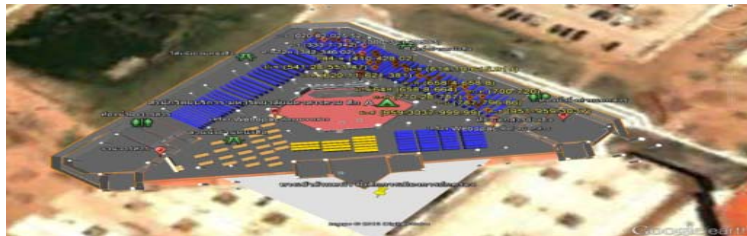
ภาพที่ 2 ภาพการนำเข้าโมเดลเสมือน 3 มิติ

ขั้นตอนที่ 2 ออกแบบจำลองโมเดล 3 มิติ จากโครงสร้างที่ได้เก็บข้อมูลจากการสำรวจดั่งภาพที่ 2