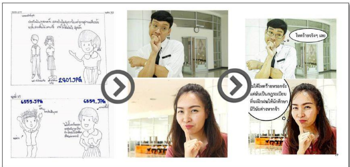
ภาพที่ 1 ลำดับขั้นตอนการทำสื่อปฐมนิเทศออนไลน์ฉบับการ์ตูน