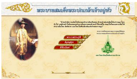
ภาพที่ 4 หน้าจอพิพิธภัณฑ์ดิจิทัลรัชกาลที่ 7

2.3 นิทรรศการถาวรในห้องพระบาทสมเด็จพระปกเกล้าเจ้าอยู่หัว และสมเด็จพระนางเจ้ารำไพพรรณี พระบรมราชินี (ห้องเอกสารรัชกาลที่ 7) เป็นการจัดนิทรรศการประเภทสิ่งของ เครื่องใช้ และสารสนเทศส่วนพระองค์ที่น่าสนใจในตู้นิทรรศการถาวรที่ติดตั้งแสดงในห้องเอกสารรัชกาลที่ 7 โดยมีวัตถุประสงค์เพื่อเผยแพร่ความรู้ และนำเสนอข้อมูลที่ที่น่าสนใจเกี่ยวกับสิ่งของ ของใช้ อาทิ แผ่นเสียงส่วนพระองค์ พระราชหัตถเลขาส่วนพระองค์ กล้องพระอิสถมวน ดวงตราและเหรียญตราสำคัญๆ ในรัชสมัยของล้นเกล้าฯ รัชกาลที่ 7 นิทรรศการถาวรนี้ อาจจะมีการเปลี่ยนแปลงเนื้อหาไปตามวาระโอกาสต่างๆ ที่เกี่ยวข้องกับพระบาทสมเด็จพระปกเกล้าเจ้าอยู่หัว