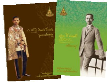
ภาพที่ 7 สมุดเสริมความรู้ และบันทึกความรู้

3.3 สมุดเสริมความรู้ และบันทึกความรู้ 120 ปี ผ่านฟ้า ประชาธิปไตย เป็นสมุดบันทึกที่จัดทำขึ้นเพื่อเสริมความรู้เกี่ยวกับ พระบาทสมเด็จพระปกเกล้าเจ้าอยู่หัว และเรื่องราวต่างๆ ที่เกิดขึ้นใน รัชสมัย เกล็ดเล็กเกร็ดน้อยที่เกี่ยวข้องกับพระองค์ท่านที่น่าสนใจ ดวง ตราสำคัญๆ เช่น ตราพระราชลัญจกรประจำพระองค์ พระปรมาภิไธย เข็มสหชาติและเข็มอุปชาติ เป็นต้น